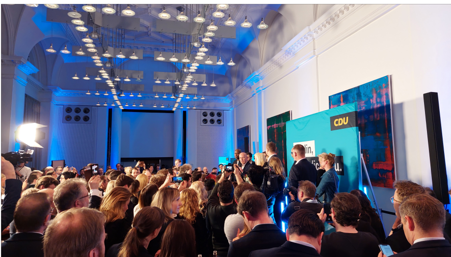
Riesenstimmung und medialer Andrang beim CDU-Wahlsieger Kai Wegner am Wahlabend im Berliner Abgeordnetenhaus

Abgeordneter wieder direkt im Wahlkreis gewählt - CDU Buckow stellt nun vier Bezirksverordnete